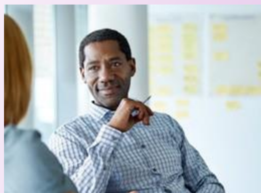
LEIS CORPORATIVAS E DE TÍTULOS