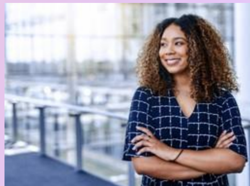
PRÁTICAS EMPREGATÍCIAS JUSTAS