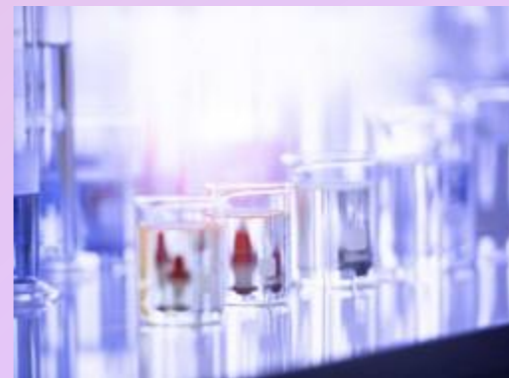
FRAUDE E CORRUPÇÃO