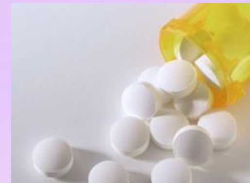
CONCORRENCIA JUSTA, PREÇOS E ANTITRUSTE