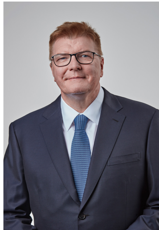
Малкольм Уїлсон (Malcolm Wilson) Головний виконавчий директор

Ви є обличчям GXO. Дякуємо, що ваші слова та дії відображають високі стандарти нашого бізнесу.